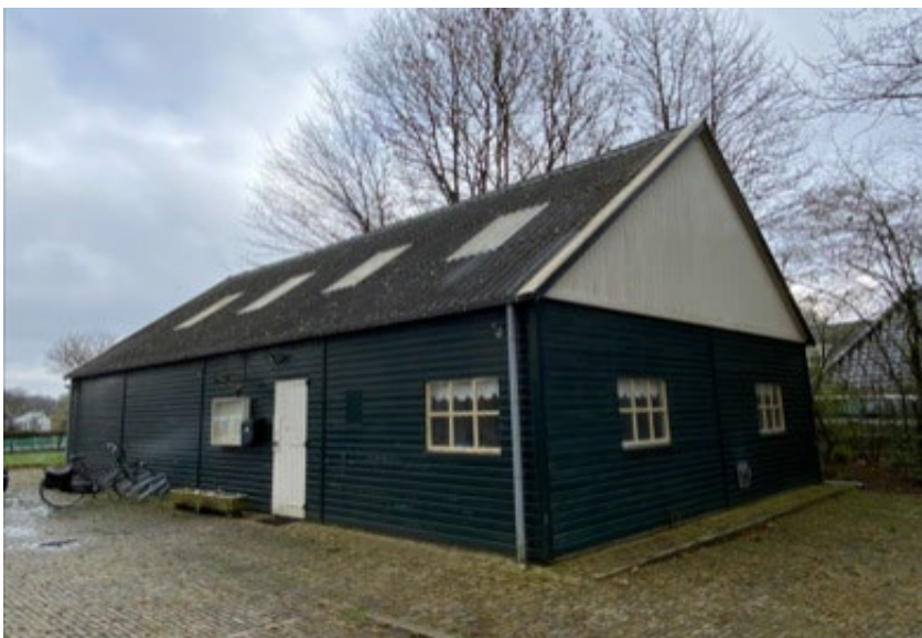
Het tuinderskwartier aan de parkeerplaats rechts naast de ingang van het complex

Woensdag 10.00 tot 11.00 uur Donderdag 19.30 tot 20.30 uur Zaterdag 10.00 tot 12.00 uur